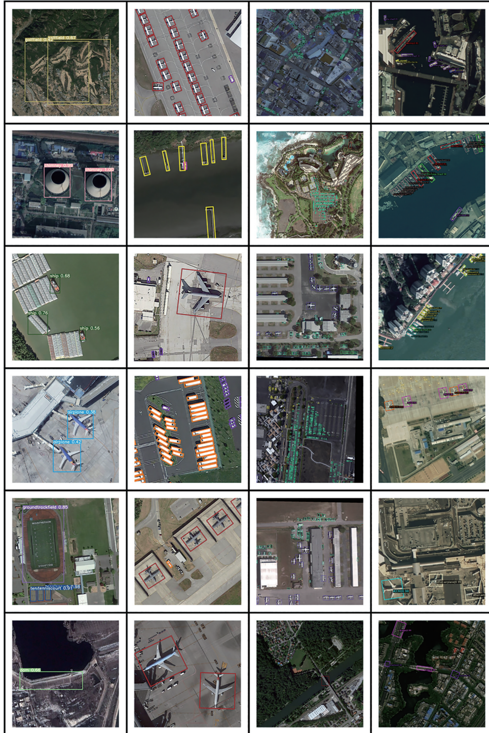
(a) 水平框 (b) 旋转框 (c) 小目标 (d) 细粒度 (a) Horizontal bounding box (b) Oriented bounding box (c) Small object (d) Fine grain

严重遮挡的问题, 极大增强了数据集对真实场景的再现, 推动了领域相关算法的发展。