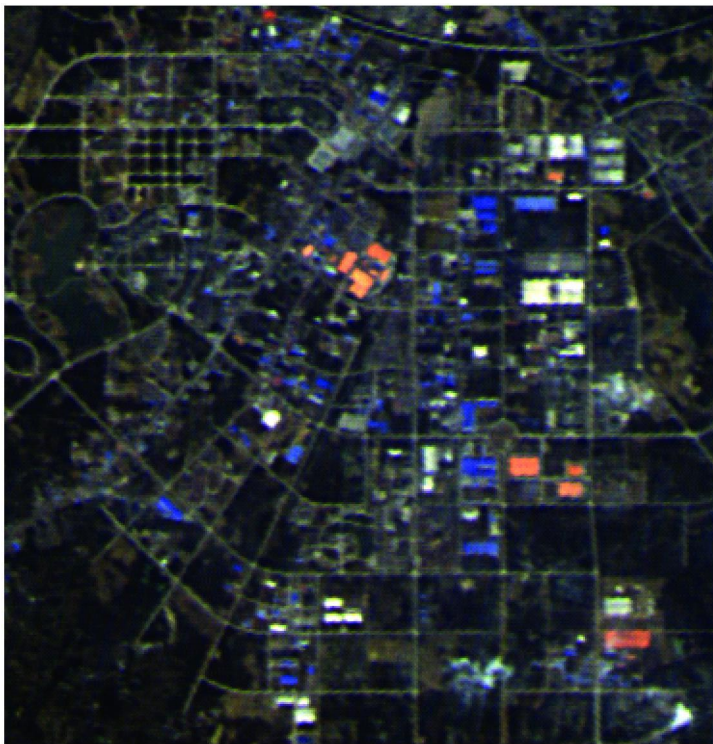
图 4 消除邻近像元影响后的合成彩色图 Fig 4 Color image after adjacency correction

相机对安徽淮北及周边地区成像数据的彩色合成图,由安徽气象局提供的当天过顶时间的能见度约为 13km,使用敦煌校正场辐射定标结果,考虑了 5 个临近像元的边缘效应,大气订正后的图像见